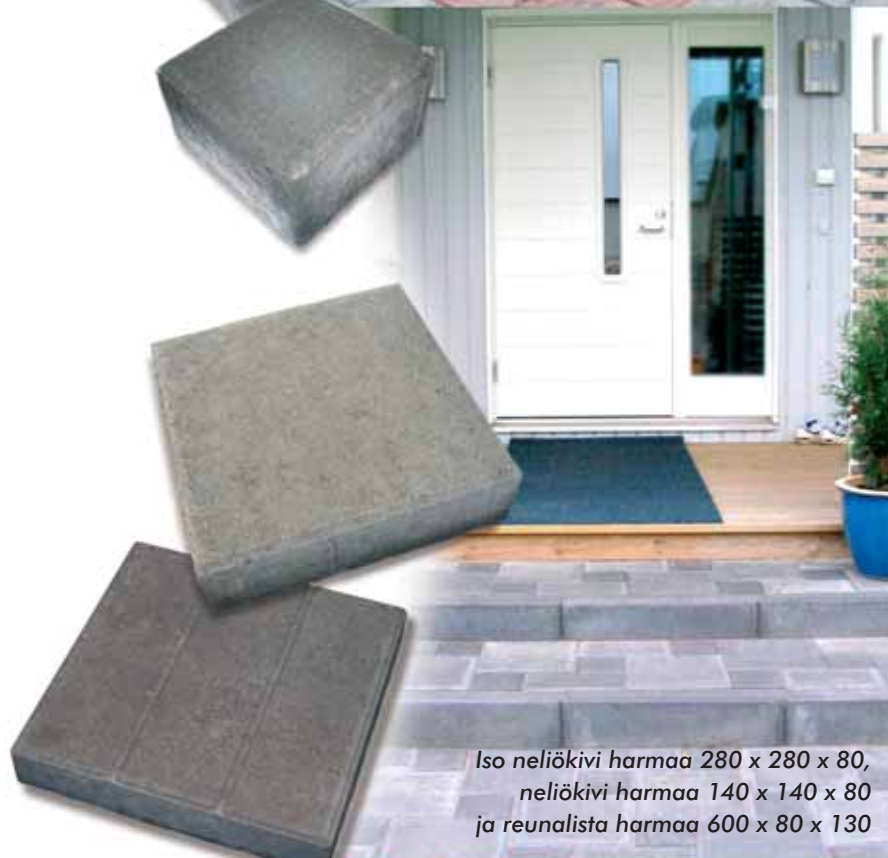
Iso neliökivi harmaa 280 x 280 x 80, neliökivi harmaa 140 x 140 x 80 ja reunalista harmaa 600 x 80 x 130