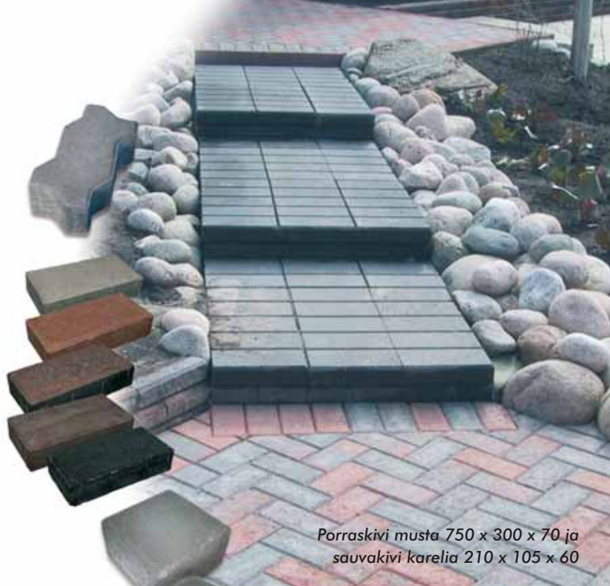
Porraskivi musta 750 x 300 x 70 ja sauvakivi karelia 210 x 105 x 60

Lisäksi valikoimastamme löytyvät myös upotettavat reunakivet